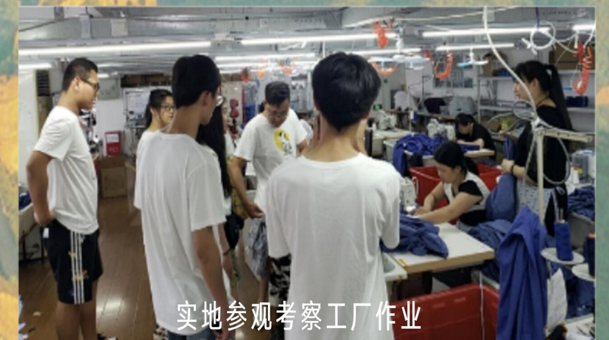
实地参观考察工厂作业