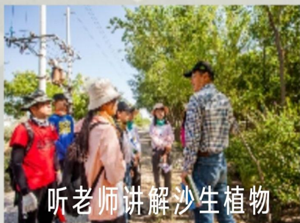
听老师讲解沙生植物